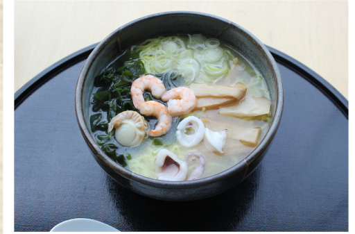
塩ラーメン ¥850 (大盛 ¥950)