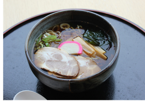
醤油ラーメン ¥850 (大盛 ¥950)