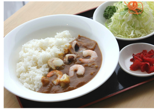
シーフードカレー ¥950 (大盛 ¥1,050)