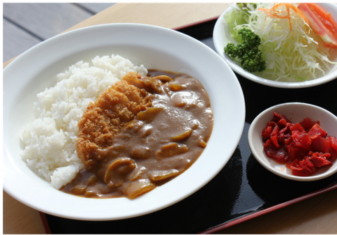
かつカレー ¥1,250 (大盛 ¥1,350)