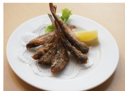
ハタハタのから揚げ ¥500