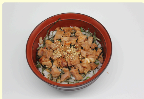
ミニチャーシュー丼