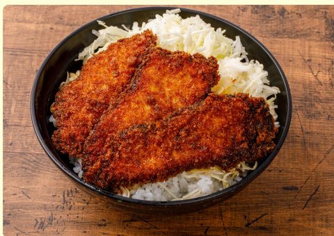
シイラのソースカツ丼 味噌汁・漬物付 1,350円