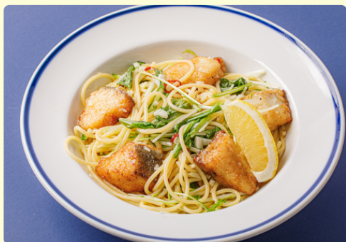
男鹿の鱈としょうつるのペペロンチーノ スープ付 1,470円

当店ではアレルギー対応をおこなっておりません。今後の仕入状況により食材メニューに変更がある場合がございます