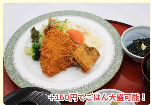
アジフライ定食 1,400円