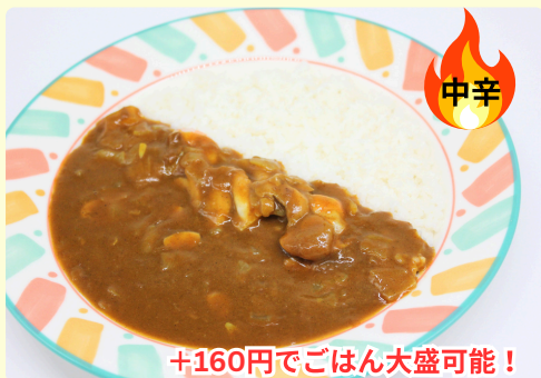
シーフードカレー 1,150円