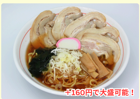
醤油チャーシュー麺 1,270円