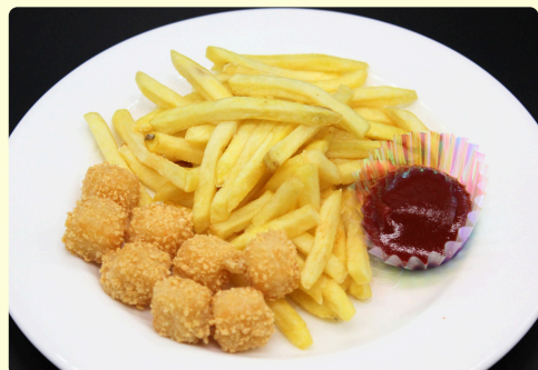
ころころチーズ&ポテト