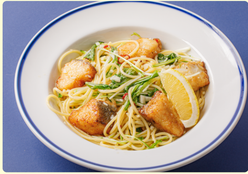
男鹿の鱈としょうつろのペペロンチーノ スープ付 1,470円