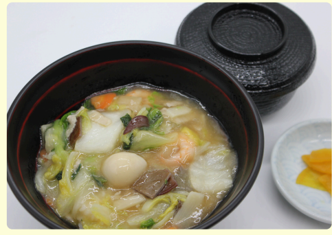
中華丼 味噌汁・漬物付 1,200円