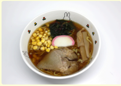
お子様ラーメン 680円