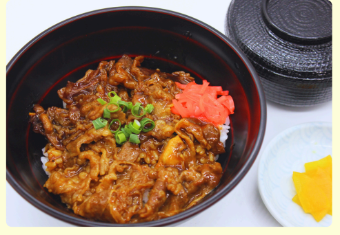
カルビ丼 味噌汁・漬物付 1,200円