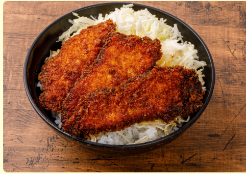
シイラのソースカツ丼 味噌汁・漬物付 1,350円