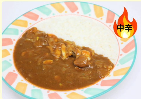
シーフードカレー 1,150円