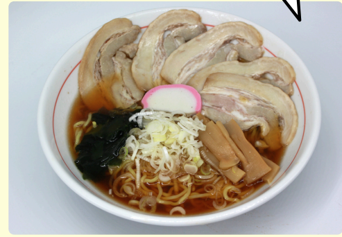
醤油チャーシュー麺 1,270円